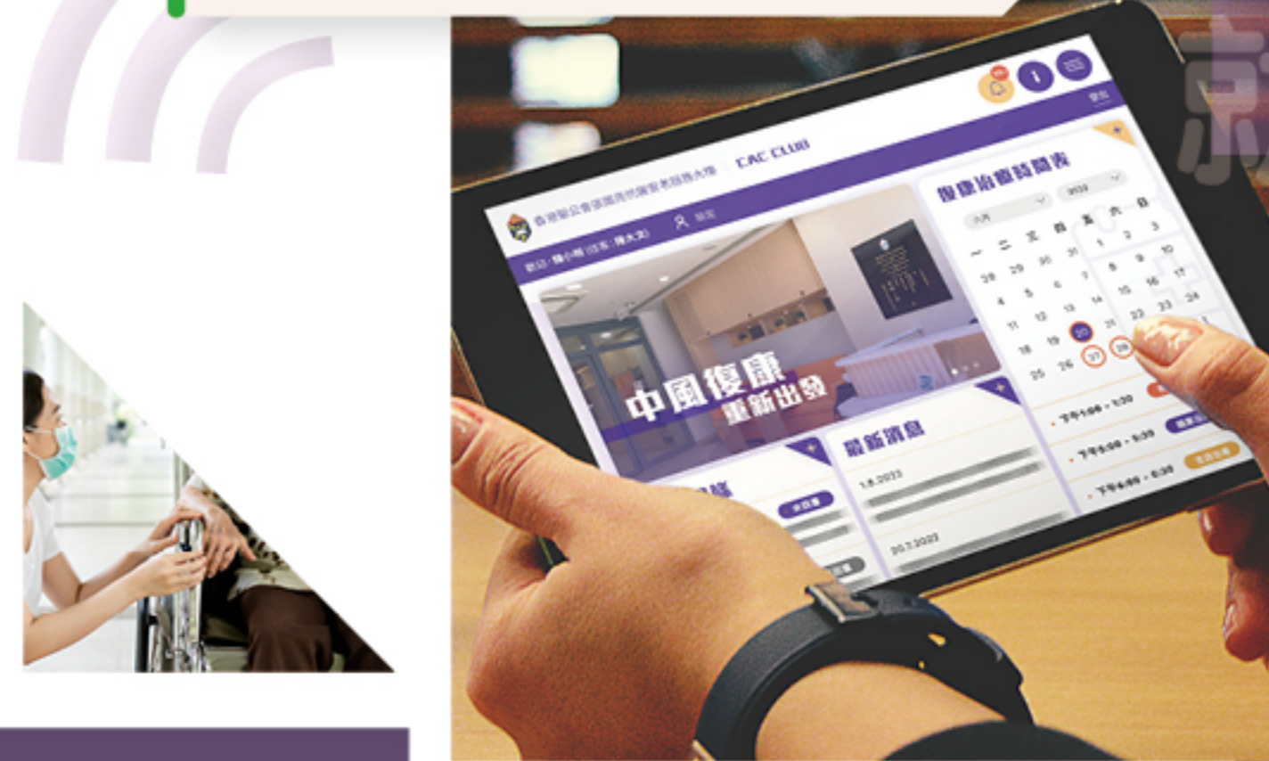
單人房 智能操控版面