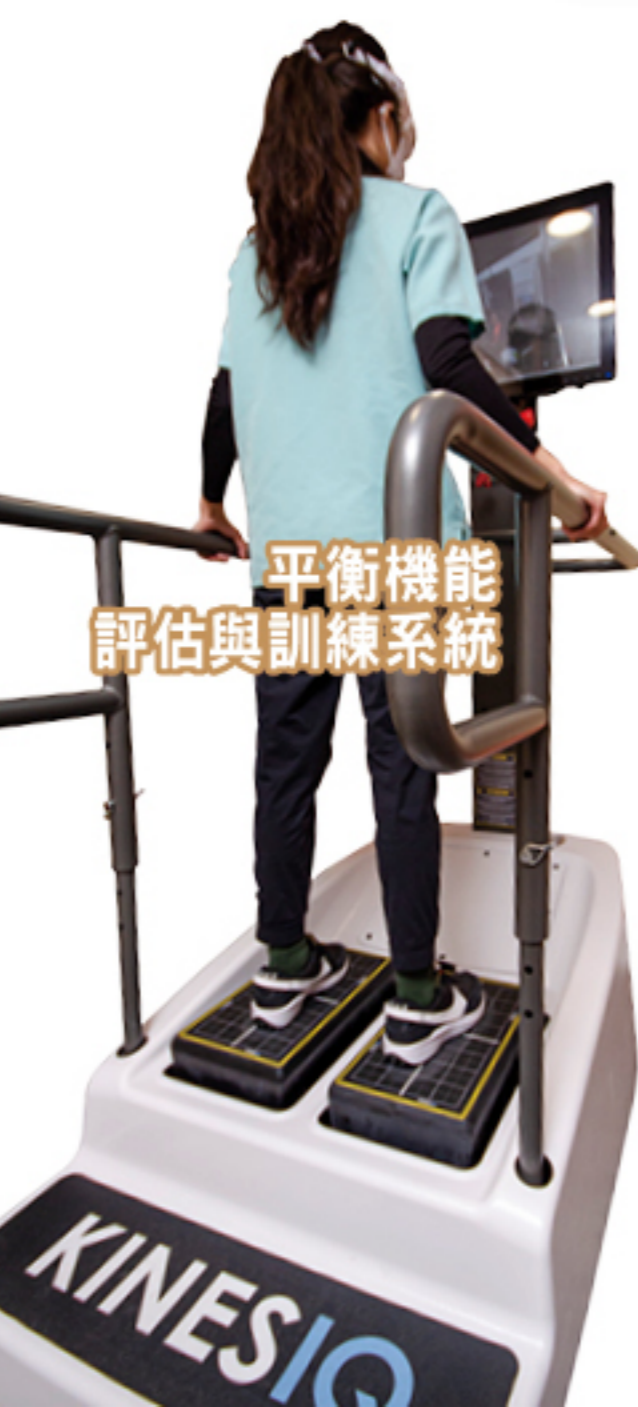
平衡機能評估與訓練系統

大樓設立了定位腦磁激療法項目，使中風患者完成相關治療後再接受密集式復康治療，效果更加顯著。